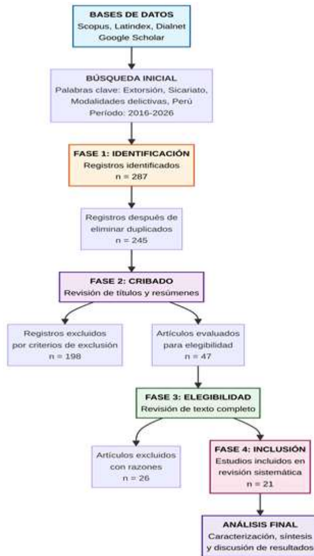
Figura 1. Diagrama del proceso de selección de estudios