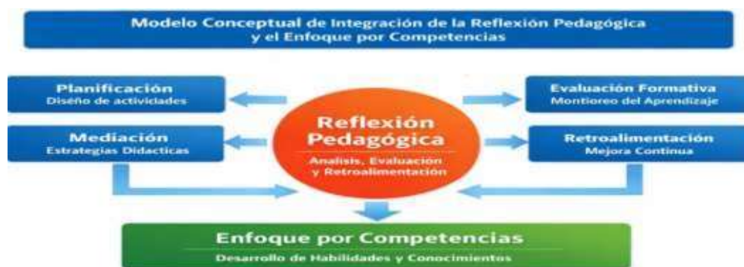
Figura 1. Modelo conceptual de integración de la reflexión pedagógica y el enfoque por competencias en la práctica educativa

Se observa que la aplicación fragmentaria del modelo basado en competencias produce una débil coherencia en la enseñanza, y la reflexión pedagógica, al llevarse a cabo de manera aislada, restringe su influencia en la institución. Sin embargo, cuando se consigue una integración pedagógica facilitada por la reflexión, se potencia el desempeño de los docentes. De igual forma, el uso limitado de la evaluación formativa disminuye la efectividad de los comentarios, y la falta de apoyo institucional se convierte en un obstáculo que complica la aplicación coordinada de estos enfoques.