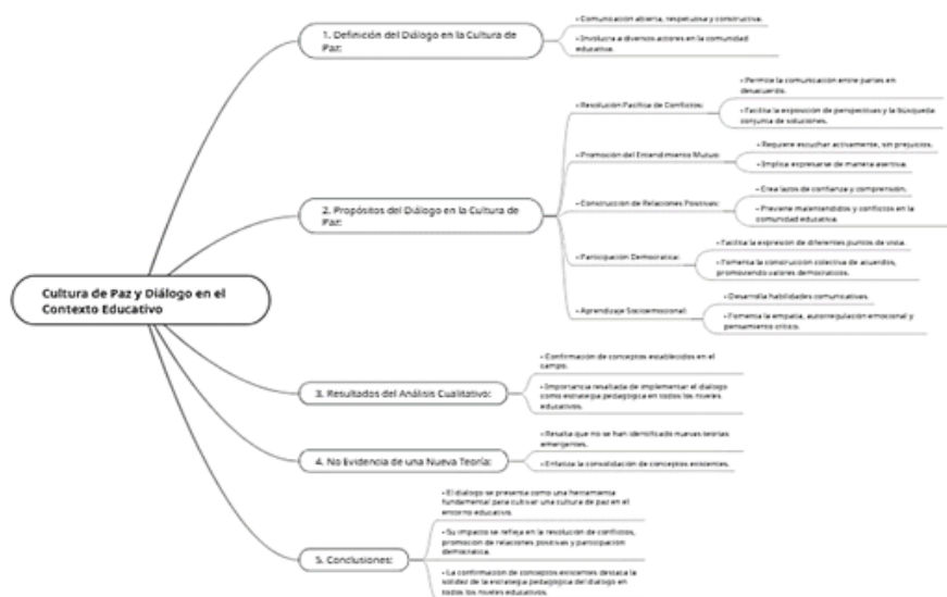
Figura 5. Esquema de caracterización del diálogo

Por otro lado, la no violencia es un principio fundamental en una cultura de paz. Los entrevistados coincidieron en que implica rechazar el uso de la fuerza física o psicológica para resolver conflictos, y promover en cambio la resolución pacífica de disputas.