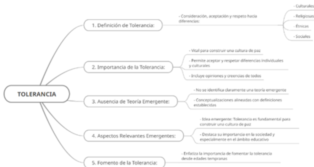
Figura 1. Esquema de caracterización de la tolerancia.

En relación a los derechos humanos, los entrevistados lo consideran como el conjunto de derechos fundamentales que todas las personas poseen. Estos protegen la dignidad, la libertad y la igualdad de los individuos y son universales, inalienables e indivisibles.