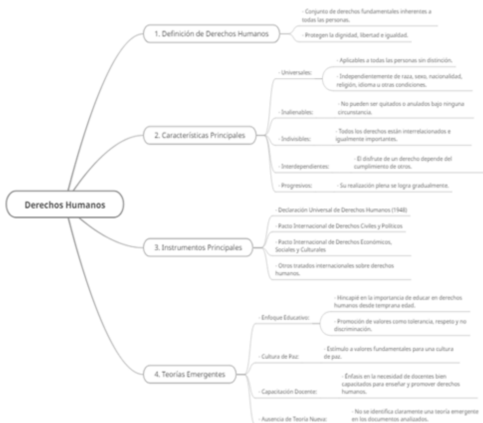
Figura 2. Esquema de caracterización de los derechos humanos

En la figura 2 se han representado las características principales que recogen los derechos humanos según el criterio de los entrevistados.