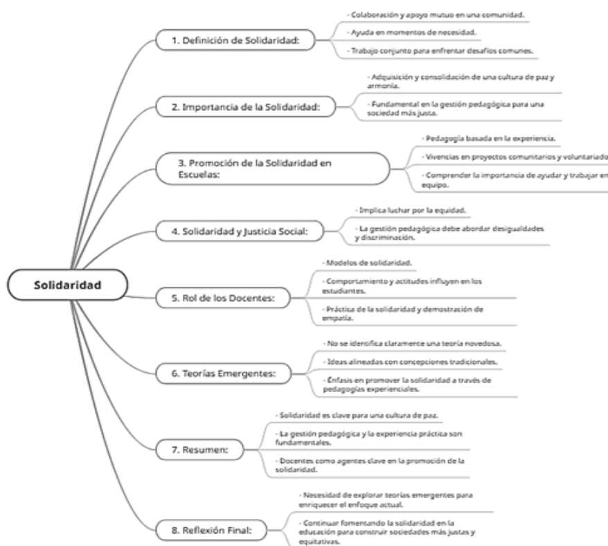
Figura 4. Esquema de caracterización de la solidaridad

Otro componente esencial de la cultura de paz en el contexto educativo es el diálogo. A razón de los participantes en el estudio, se trata de una comunicación abierta, respetuosa y constructiva entre los diferentes actores de la comunidad educativa para promover la convivencia, la solución de conflictos y el entendimiento mutuo. Algunos conceptos clave sobre el diálogo en la cultura de paz que emergen del análisis cualitativo son: herramienta para resolver conflictos de forma pacífica, ya que implica que las partes en desacuerdo se comuniquen, expongan sus perspectivas y busquen soluciones de manera conjunta. Promueve el entendimiento mutuo. Comunicación abierta y respetuosa porque el diálogo implica que cada parte escuche de manera activa al otro, con respeto y sin prejuicios, para esto se requiere expresarse de manera asertiva. Construcción de relaciones positivas porque el diálogo frecuente crea lazos de confianza y