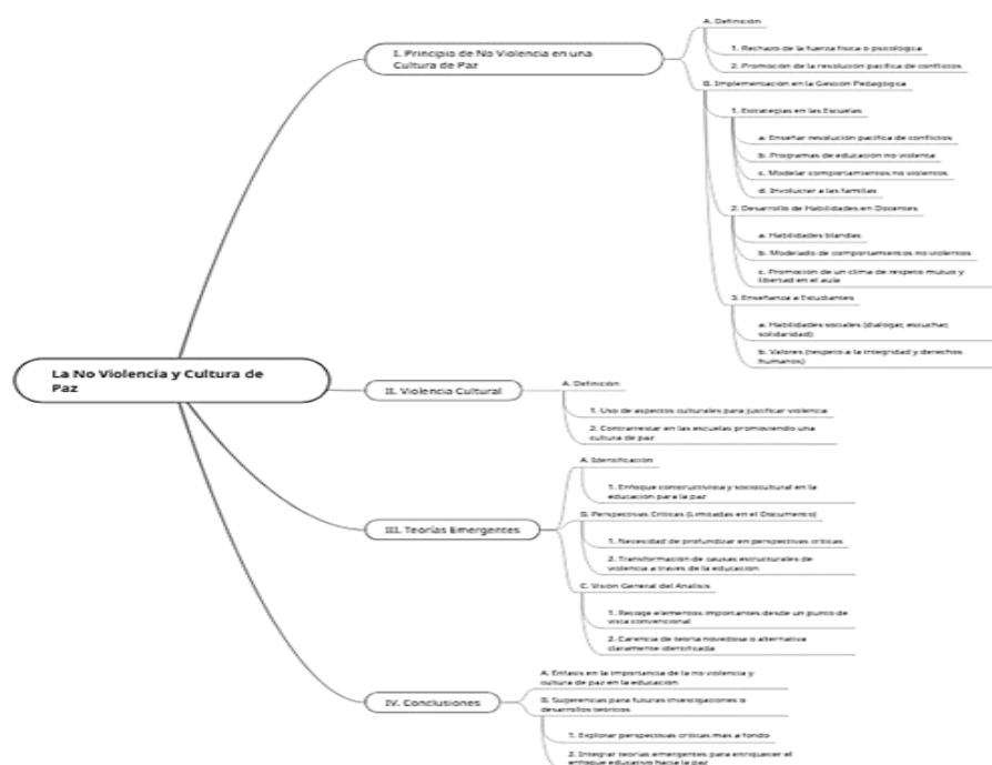
Figura 6. Esquema de caracterización de la no violencia.

En la figura 6 se puede apreciar los rasgos distintivos de la no violencia expresado por los entrevistados.