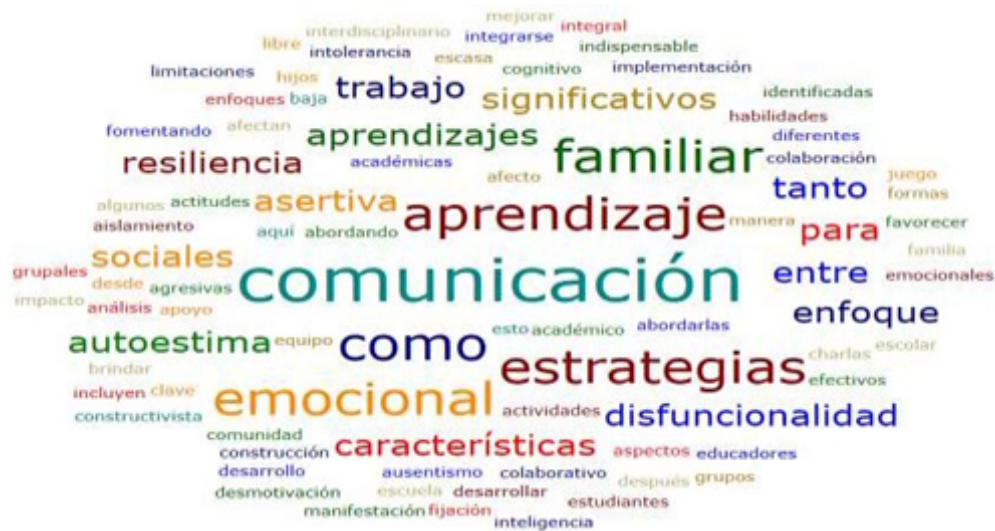
Figura 4. Disfuncionalidad Familiar y su Impacto en el Aprendizaje: Estrategias de Mitigación