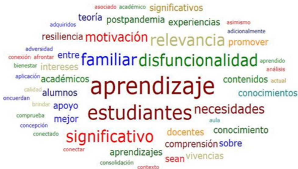
Figura 1. Relevancia del aprendizaje significativo estudiantes con disfuncionalidad familiar pospandemia.